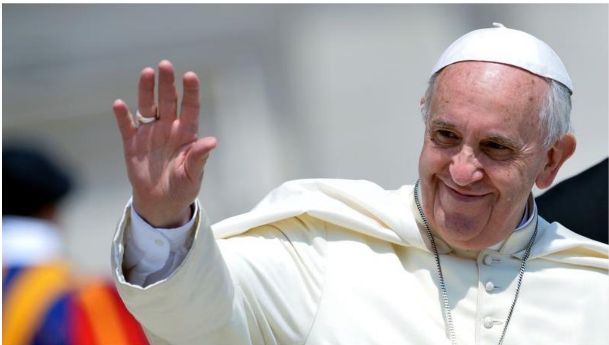
Le pape François, à la fin de son audience du 27 mai 2015.

Baptiste et Édouard, deux élèves de première, ont choisi de réaliser leurs travaux personnels encadrés (TPE) sur l'influence de l'Église catholique en France.